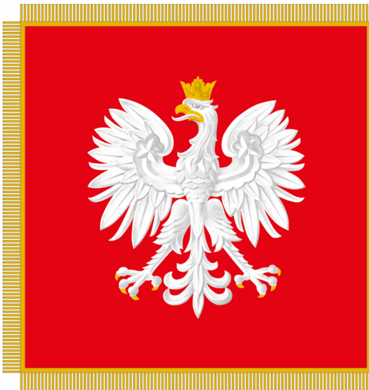
Strona główna płata