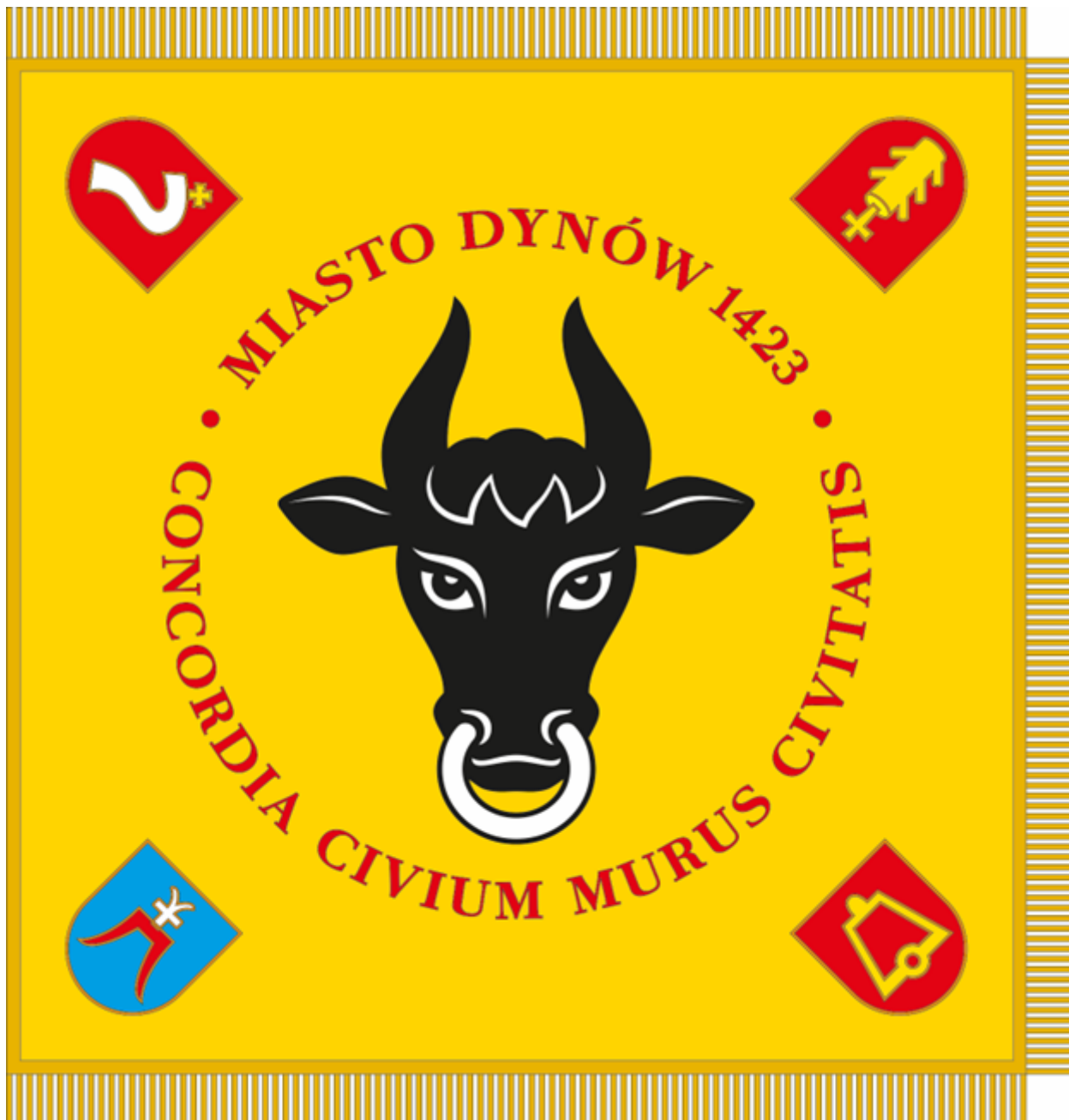
Strona odwrotna płata